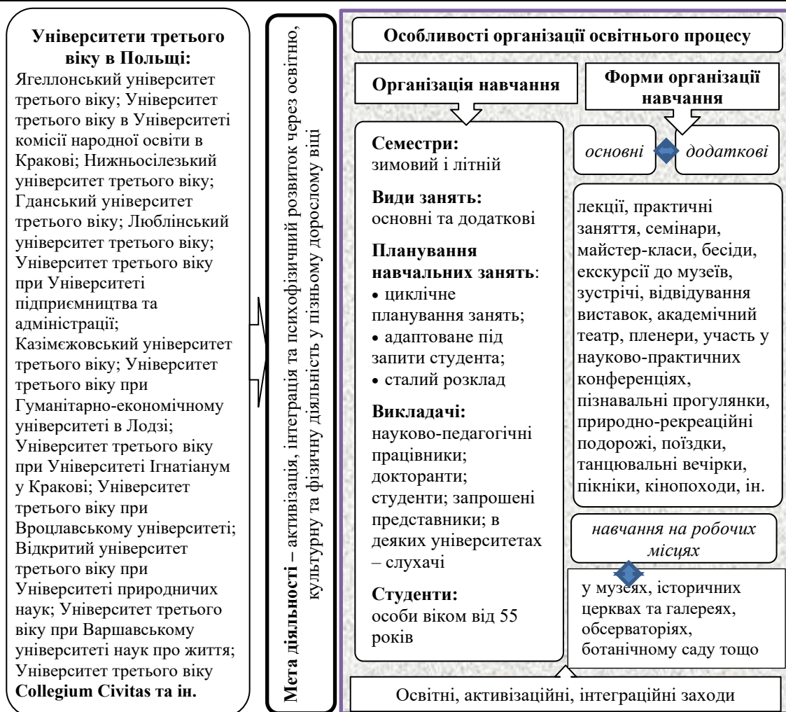
Рис. 1. Особливості організації освітнього процесу в університетах третього віку в Польщі Змістові характеристики освітніх програм для слухачів університетів третього віку в Польщі представлено в таблиці 1.