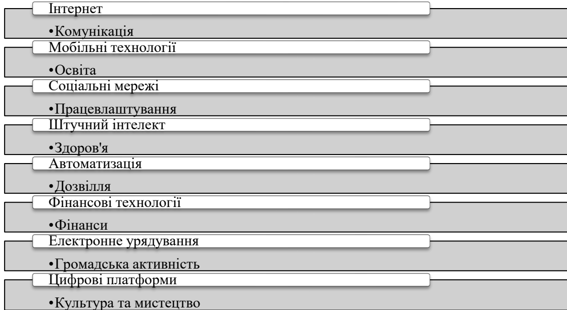
Рис. 1. Взаємодія цифрових технологій з основними аспектами повсякденного життя

сферах, таких як розробка програмного забезпечення, кібербезпека й аналіз даних. Соціальні мережі та цифрові платформи стають важливими інструментами для спілкування й обміну інформацією. Вони дають змогу людям легко контактувати з друзями, родиною і колегами, а також брати участь у суспільному житті, обговорюючи важливі питання і висловлюючи свої думки. Однак, значне використання соціальних мереж також пов'язане з ризиками, такими як поширення дезінформації, загроза конфіденційності та кібербулінг. Як взаємодіють цифрові технології з основними аспектами повсякденного життя показано на рисунку 1.