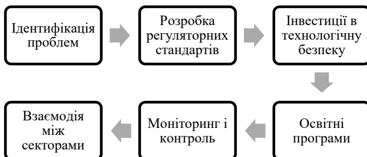
Рис. 3 Алгоритм комплексного підходу до вирішення етичних проблем, пов'язаних з використанням цифрових технологій

Поширення дезінформації та фейкових новин стало можливим завдяки швидкому розповсюдженню інформації в цифровому середовищі. Це явище становить серйозну загрозу для суспільної довіри та демократичних процесів. Соціальні мережі й інші цифрові платформи часто стають інструментами маніпуляції, поширення ненависті та дестабілізації суспільства. Для боротьби з дезінформацією необхідно розробити ефективні механізми виявлення та видалення неправдивої інформації. Підвищення медіаграмотності населення також є важливим кроком, що дасть змогу громадянам критично оцінювати отриману інформацію і сприятиме формуванню здорового інформаційного середовища. У сучасних умовах вирішення етичних проблем, пов'язаних з використанням цифрових технологій, вимагає комплексного підходу, що передбачає активну участь державних органів, приватних компаній і громадянського суспільства у формуванні етичних стандартів і практик у цифровому середовищі.